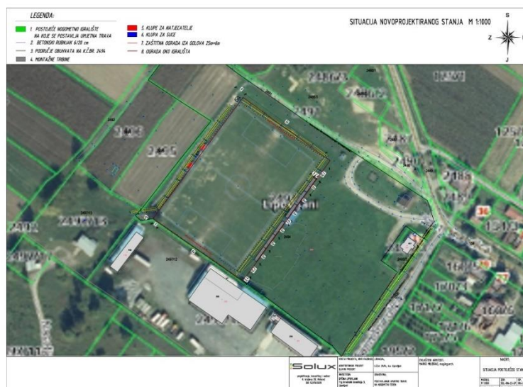
Projekt rekonstrukcije sportsko rekreacijske zone