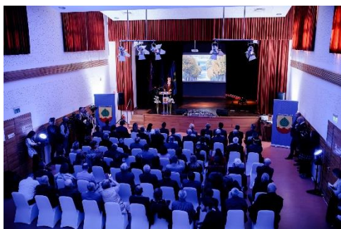
Dan Općine Lipovljani