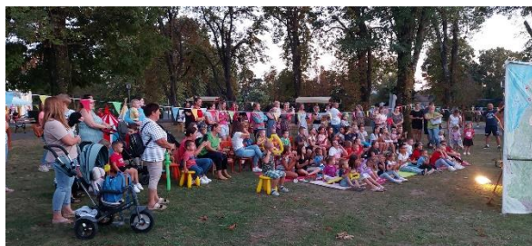
Ljeto za pet, park Lipovljani