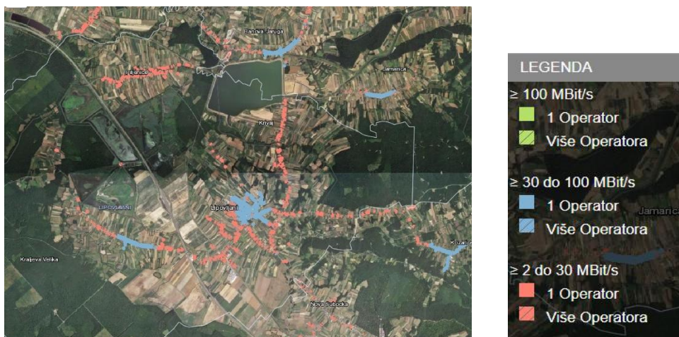
Slika: Pokrivenost područja općine Lipovljani širokopojasnim pristupom internetu